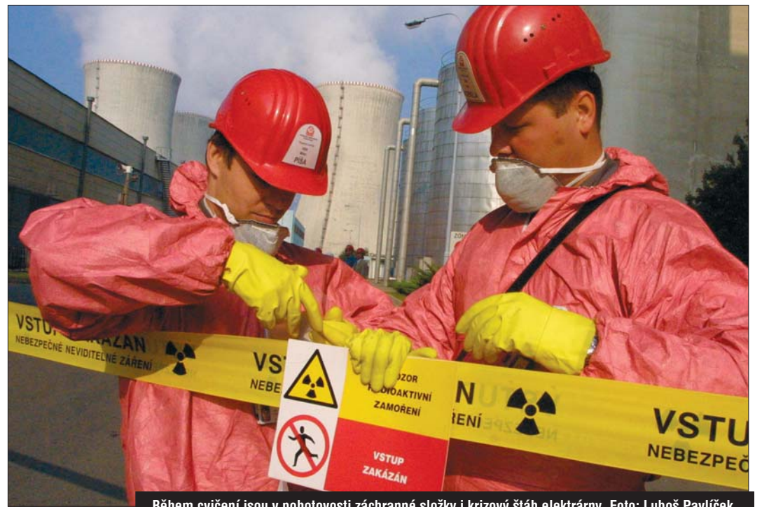
Během cvičení jsou v pohotovosti záchranné složky i krizový štáb elektrárny.

účinným ochranným opatřením. Máme připraveny evakuační plány, podle nichž jsou lidé evakuováni do předem stanovených příjmo-